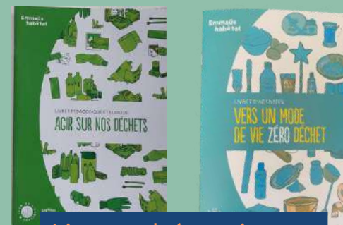
Livrets thématiques réalisés avec Emmaüs Habitat

Selon les projets et les participations aux ateliers, nos interventions prennent la forme de "défis", d'animations ponctuelles ou permanentes sur site, de webinaires (ateliers participatifs en ligne), d'aménagements collectifs de lieux, etc