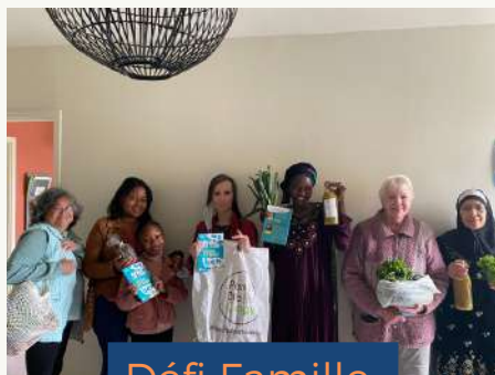
Défi Famille presque zéro déchet

Le pouvoir de notre Potion de fées : créer un parcours d'ateliers sur-mesure pendant plusieurs semaines pour impulser chez les bénéficiaires une transition vers un mode de vie zéro déchet au sein de leur lieu de vie.